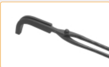
Tenaglia a becchi curvi per crogioli Curved tongs for crucibles Tenaille à becs ecourbés pour creusets 0116/1 | L = 500 mm 0116/11 | L = 600 mm 0116/2 | L = 700 mm 0116/3 | L = 800 mm