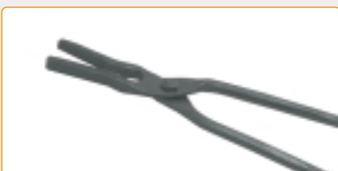
0116/5 | Tenaglia a becchi diritti per crogioli, L = 600 mm Straight tongs for crucibles L = 600 mm Tenaille à becs droits pour creusets. L = 600 mm