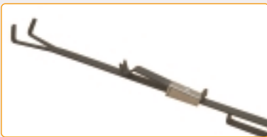
0120B | Porta-crogiolo senza molla per crogioli quadri Crucible holder without spring for square crucibles Porte-creuset sans ressort pour creusets carrés