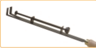
0120A | Porta-crogiolo a molla per crogioli quadri Spring crucible holder for square crucibles Porte-creuset à ressort pour creusets carrés