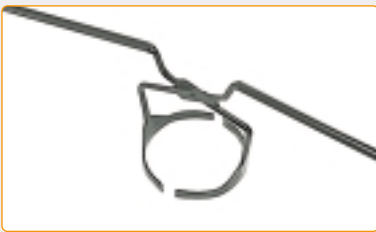
Tenagioni per estrazione crogiolo (grandezza crogiolo, vedi sotto) Crucible tongs (crucible size, see below) Tenailles pour extraction du creuset (taille du creuset, voir ci-dessous) 0116/01 | P. 25 0116/02 | P. 50 0116/03 | P. 100