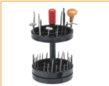
0700/689 | Porta-utensili girevole a due vassoi ø 130 mm (porta fino a 30+30 utensili) Turning tools support with two trays ø 130 mm (holds up to 30 + 30 tools) Porte-outils tournant à deux plateaux ø 130 mm (porte jusqu'à 30+30 outils)