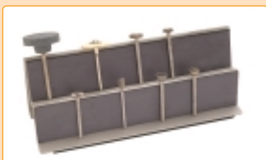
0825B/10 | Porta frese magnetico Magnetic cutters container Porte-fraise magnétique