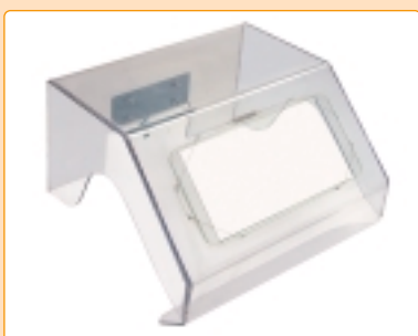
0839 | Cappa protettiva in plexiglass per fresatori, schermo di vetro intercambiabile, Ripara gli occhi e limita la dispersione della limatura nell'ambiente. Fissaggio mediante supporto metallico con perno da inserire nello stocco. Plexiglass protective hood for milling, changeable glass screen, perfect visibility. Protects eyes and prevents filings scattering. Fixed via a jointed support into the bench peg. Hotte de protection en plexiglass pour fraisières, écran de verre interchangeable. Protège les yeux et évite la dispersion de la limaille. Fixage à l'aide d'un support dénoué à appliquer à la cheville.