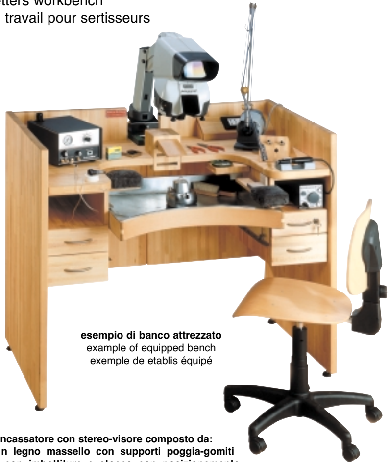
esempio di banco attrezzato example of equipped bench exemple de etablis équipé